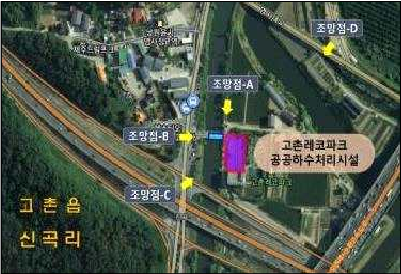
< 조망점 위치도 >