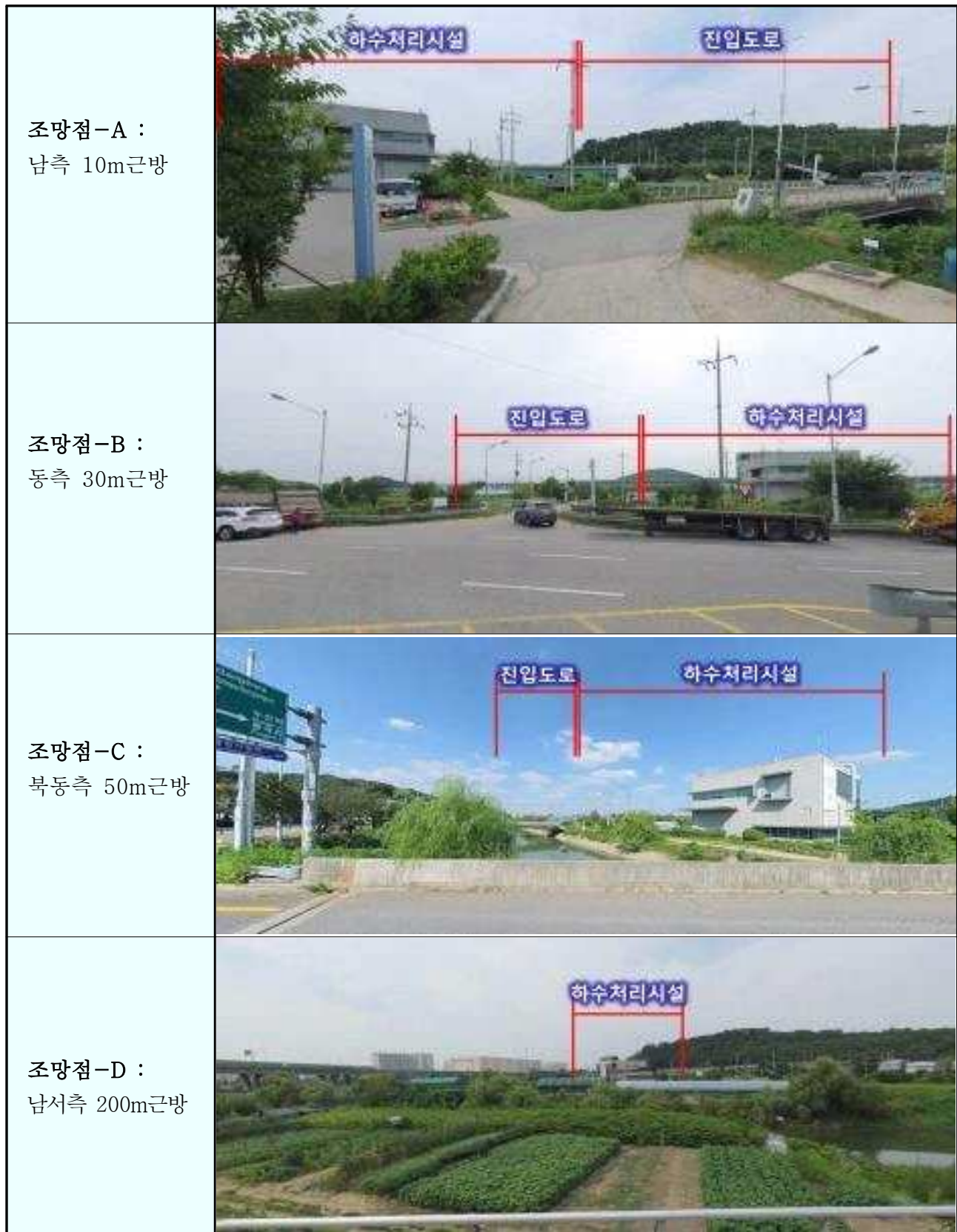
조망점 현황사진 >