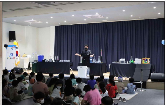
<마산도서관 사이언스 매직쇼 운영 사진>