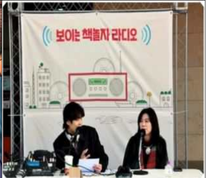
2019년 제2회 도서관 책 축제