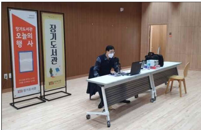
<장기도서관 청소년 경제살롱 운영 사진>