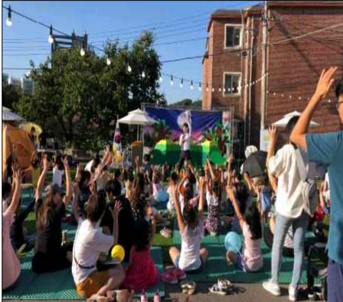
2018년 제1회 도서관 책 축제