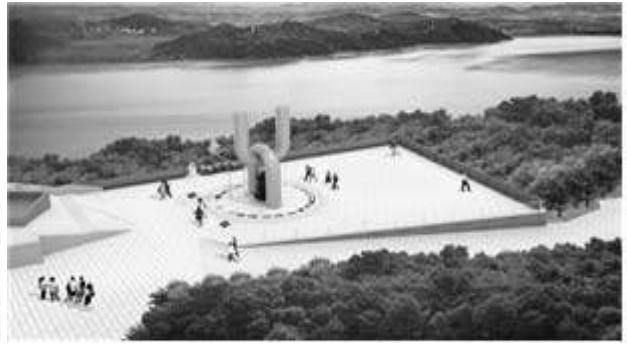
세계 평화의 종 모형도