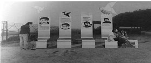
노벨 평화문화상 조형물