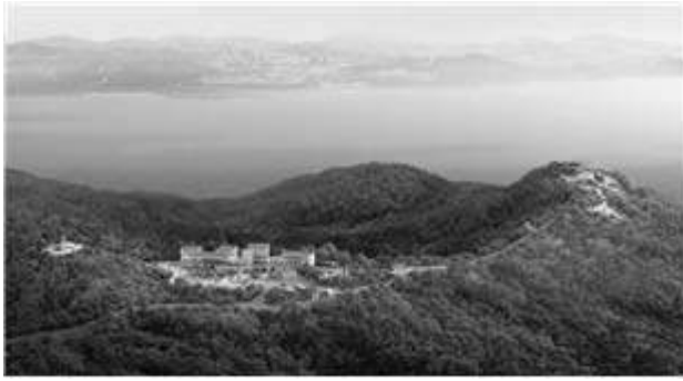
애기봉 평화생태공원 조감도