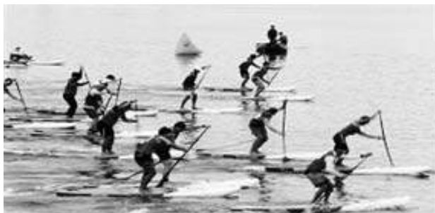
국제 스탠딩보드 선수권 대회