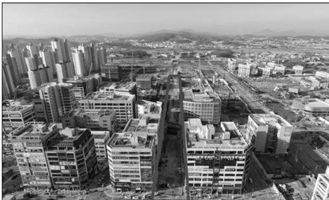
구래동 문화의 거리 위치