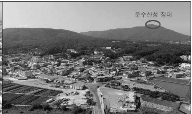
군하리 문화마을 위치