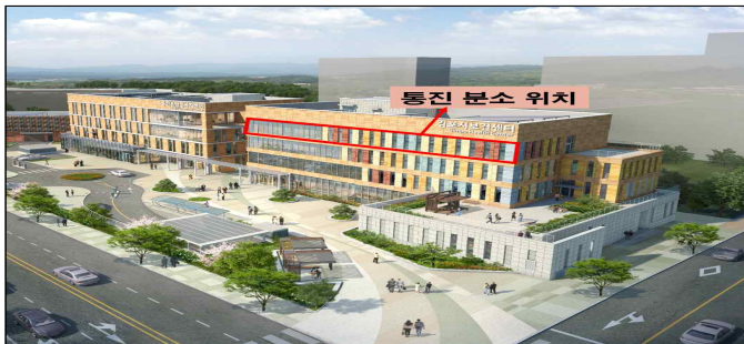
통진 분소 (통진읍 북부보건센터 4층)