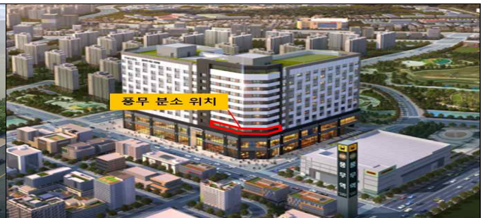
풍무 분소 (풍무동 888 '파크트루엘' 2층)