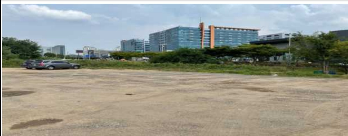
양촌산업단지 내 공원·녹지