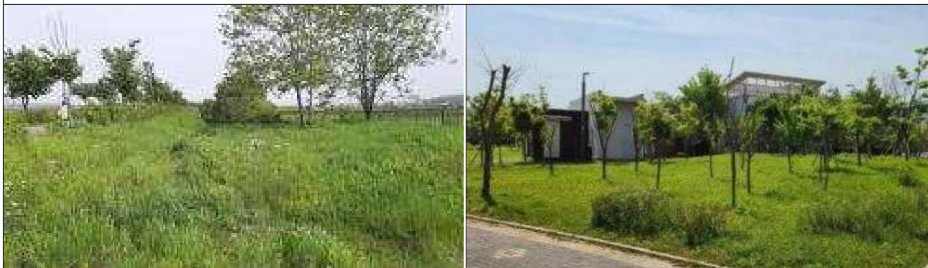
생활환경 숲 조성 사업지